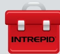
INTREPID™ Polling Protocol II (IPP II)

A SouthwestMicrowave está comprometida em fornecer soluções de segurança de perímetro que se integram de modo perfeito aos programas de segurança gerais de nossos clientes. Oferecemos a documentação do Software Development Kit (SDK) para os desenvolvedores e integradores de sistemas para os sistemas de detecção de invasões de perímetro INTREPID™ Series II (MicroPoint™ II, MicroTrack™ II, MicroWave 330) possibilitando descoberta, monitoramento, comando e controle dessas tecnologias por meio de sistemas novos ou existentes de gerenciamento de informações de segurança física (PSIM), tecnologias de avaliação (CFTV / DVR) e outras aplicações de controle personalizado.