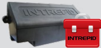
Remote Polling Module II (RPM II)