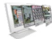
Perimeter Security Manager (PSM)