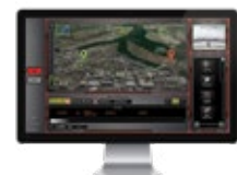
Perimeter Security Manager II (PSM II)