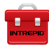
INTREPID™ Polling Protocol II (IPP II) - SDK Remote Polling Module II (RPM II) - SDK