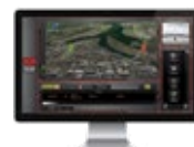
Perimeter Security Manager II (PSM II)